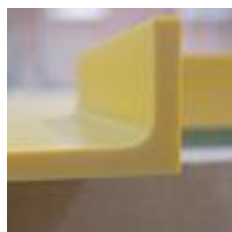
Spritzschutz-Übergang: nahtlos, hygienisch und funktional

Beim Finish Ihrer maßgeschneiderten Corian® Küche können Sie individuelle Akzente setzen - beispielweise mit einem optisch nahtlosen Übergang zum Spritzschutz, Edelstahl-Einsätzen zum Abstellen von heißen Gegenständen oder speziellen Abtropfflächen.