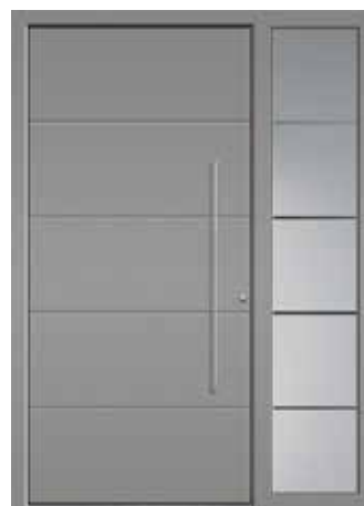
ARTIS mit Seitenteil, modellbezogenes Sandstrahlmotiv „Artis“