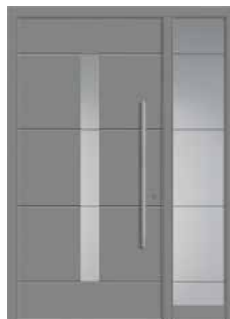
DILAN mit Seitenteil, modellbezogenes Sandstrahlmotiv „Dilan“