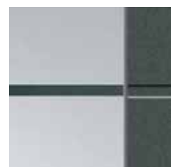
1 Sandstrahlmotiv mit klarem Streifen waagrecht

Sie erhalten die Haustüren und Seitenteile preisgleich mit den modellabhängig möglichen Gläsern