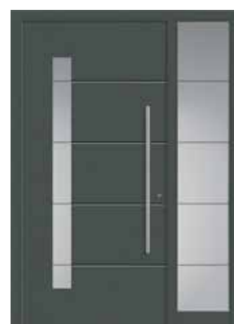
ACOR mit Seitenteil, modellbezogenes Sandstrahlmotiv „Acor“