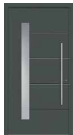
ACOR Abb. mit Sandstrahlglas vollflächig (3), wahlweise auch mit Sandstrahlmotiv waagrecht (1), senkrecht (2) oder Klarglas (4) lieferbar