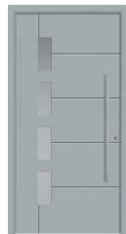
SCOTA Abb. mit Sandstrahlglas vollflächig (3), wahlweise auch mit Sandstrahlmotiv waagrecht (1), senkrecht (2) oder Klarglas (4) lieferbar

✓ INCLUSIVE: die modellabhängig wählbaren Gläser im Detail