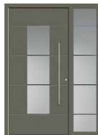
DACO mit Seitenteil, modellbezogenes Sandstrahlmotiv „Daco“