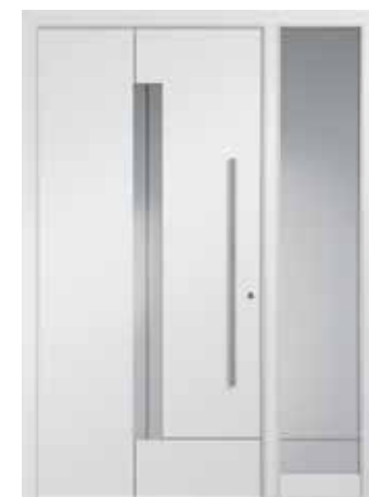
CADIX mit Seitenteil, modellbezogenes Sandstrahlmotiv „Cadix“