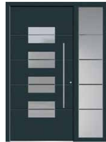
CARA mit Seitenteil, modellbezogenes Sandstrahlmotiv „Cara“