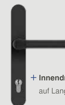
+ Innendrücker auf Langschild schwarz