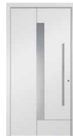
CADIX Abb. mit Sandstrahlglas vollflächig (3), wahlweise auch mit Sandstrahlmotiv senkrecht (2) oder Klarglas (4) lieferbar