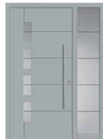
SCOTA mit Seitenteil, modellbezogenes Sandstrahlmotiv „Scota“