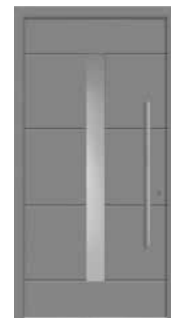
DILAN Abb. mit Sandstrahlglas vollflächig (3), wahlweise auch mit Sandstrahlmotiv waagrecht (1), senkrecht (2) oder Klarglas (4) lieferbar