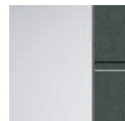
3 Sandstrahlglas vollflächig