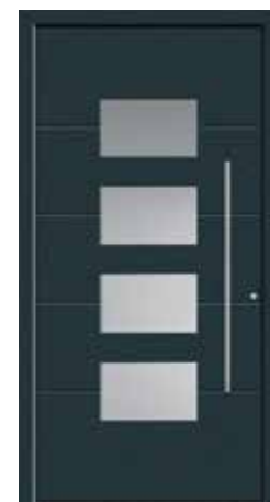
CARA Abb. mit Sandstrahlglas vollflächig (3), wahlweise auch mit Sandstrahlmotiv waagrecht (1) oder Klarglas (4) lieferbar