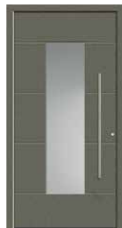
DACO Abb. mit Sandstrahlglas vollflächig (3), wahlweise auch mit Sandstrahlmotiv waagrecht (1) oder Klarglas (4) lieferbar