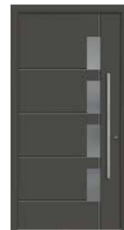
LUCA Abb. mit Sandstrahlglas vollflächig (3), wahlweise auch mit Sandstrahlmotiv senkrecht (2) oder Klarglas (4) lieferbar