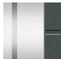
2 Sandstrahlmotiv mit klarem Streifen senkrecht