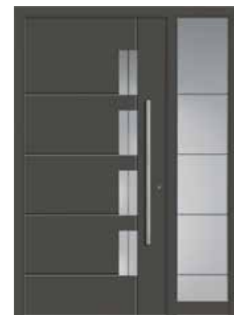
LUCA mit Seitenteil, modellbezogenes Sandstrahlmotiv „Luca“