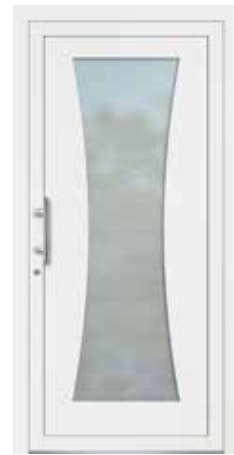
THORIN rahmenloser Glasausschnitt Glas Mattierung „Bonn“ Griff MAIKE, Edelstahl