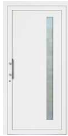
NORI rahmenloser Glasausschnitt Glas Mattierung „Bonn“ Griff MAIKE, Edelstahl