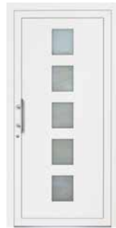
MEHA rahmenlose Glasausschnitte Glas Mattierung „Bonn“ Griff MAIKE, Edelstahl