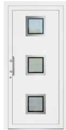
ANDELE Edelstahlrahmen Glas Mattierung „Berlin“ Griff MAIKE, Edelstahl