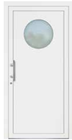
BOMBUR rahmenloser Glasausschnitt Glas Mattierung „Bonn“ Griff MAIKE, Edelstahl

BASIC CLASS Haustüren aus Kunststoff oder aus Aluminium