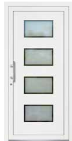
NILDA rahmenlose Glasausschnitte Glas Mattierung „Berlin“ Griff MAIKE, Edelstahl