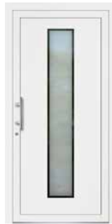
KETIL rahmenloser Glasausschnitt Glas Mattierung „Bonn“ Griff MAIKE, Edelstahl