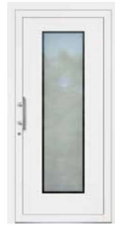
FILI rahmenloser Glasausschnitt Glas Mattierung „Berlin“ Griff MAIKE, Edelstahl